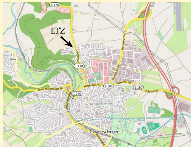
Karte erstellt aus OpenStreetMap-Daten, Lizenz: Creative Commons BY-SA 2.0

Von der Autobahn A81 bei der Ausfahrt 37 Dreieck Bad Dürkheim auf den Autobahnzubringer A864 Richtung Freiburg/Donaueschingen abbiegen. Am Ende in die linke Spur einordnen auf die B27 Richtung Freiburg/Donaueschingen. Nächste Ausfahrt Donaueschingen-Nord/Flughafen abfahren. Rechts abbiegen auf die Dürkheimer Straße. Beim ersten Kreisverkehr geradeaus, beim zweiten Kreisverkehr die erste Ausfahrt rechts in den Hindenburgring. Auf dem Hindenburgring bei der ersten Kreuzung geradeaus, bei der zweiten Kreuzung rechts in die Villinger Straße einbiegen. Die LTZ-Außenstelle befindet sich am Ortsausgang auf der linken Seite.